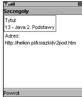
Rysunek 5.2. Wyświetlanie szczegółów elementu

Możliwości rozbudowy tego projektu nie są bynajmniej małe. Można dodać opcję archiwizacji pobranych wiadomości — za pomocą RMS. Należy też pamiętać, że program obsługuje tylko część formatu RSS — dodanie obsługi pozostałych jego elementów, zwłaszcza elementu image , może być bardzo ciekawym wyzwaniem.