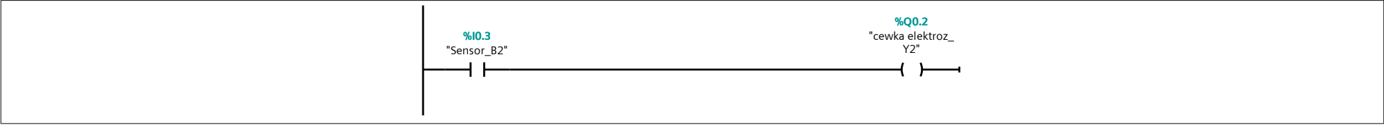
Network 3: Ustawienie licznika na wrtość 5