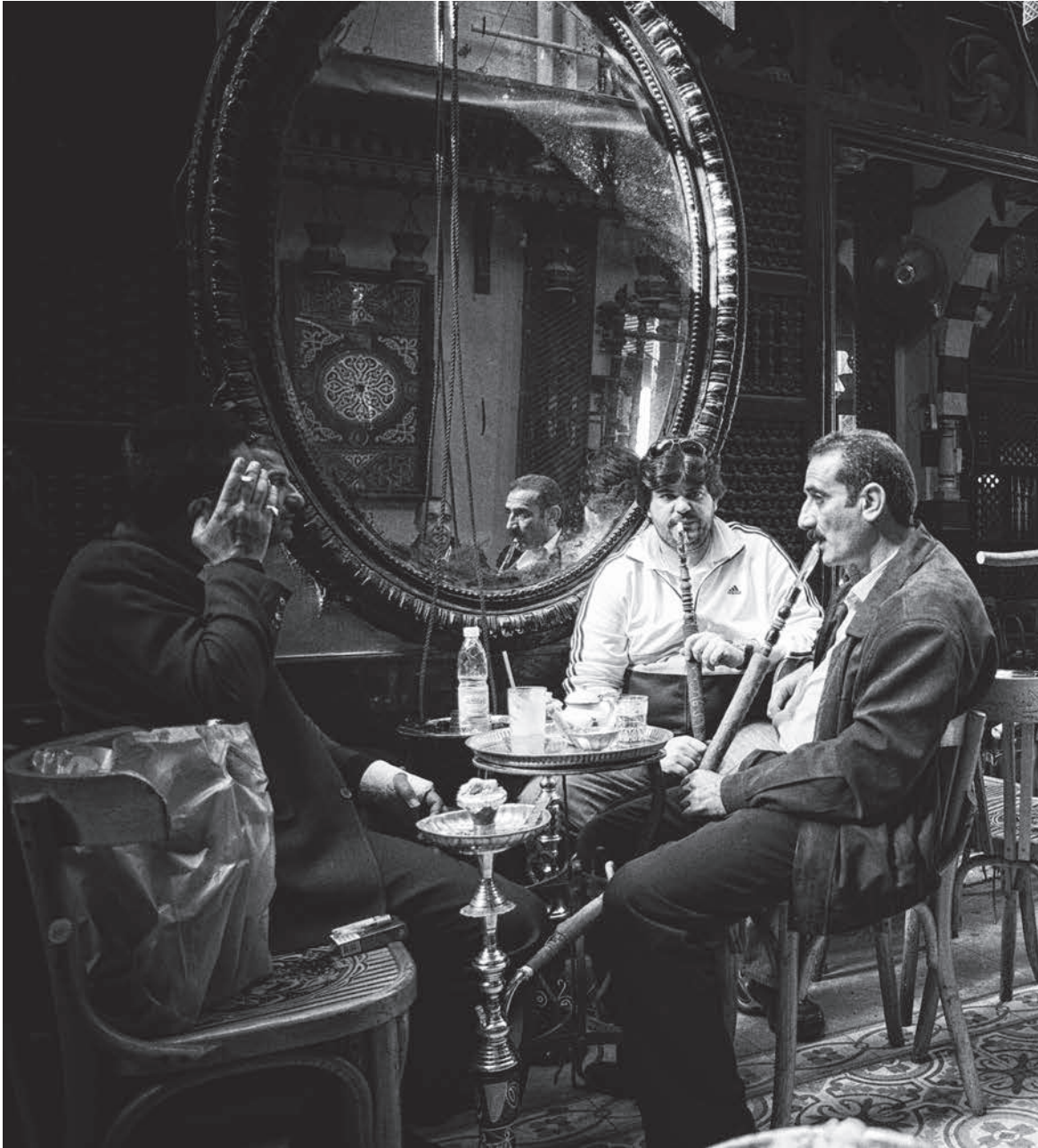
Kair, Egipt 2009