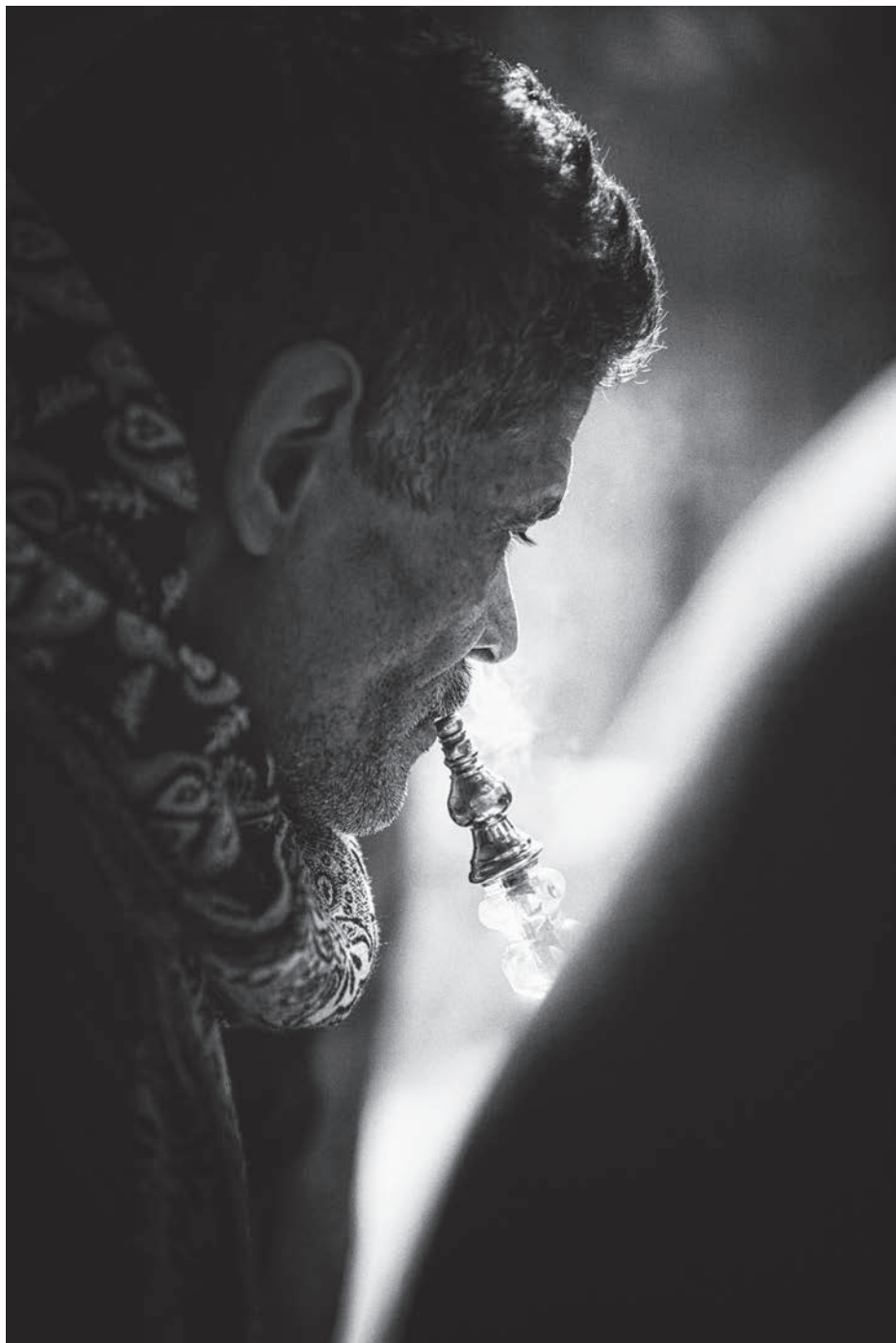
Kair, Egipt 2009