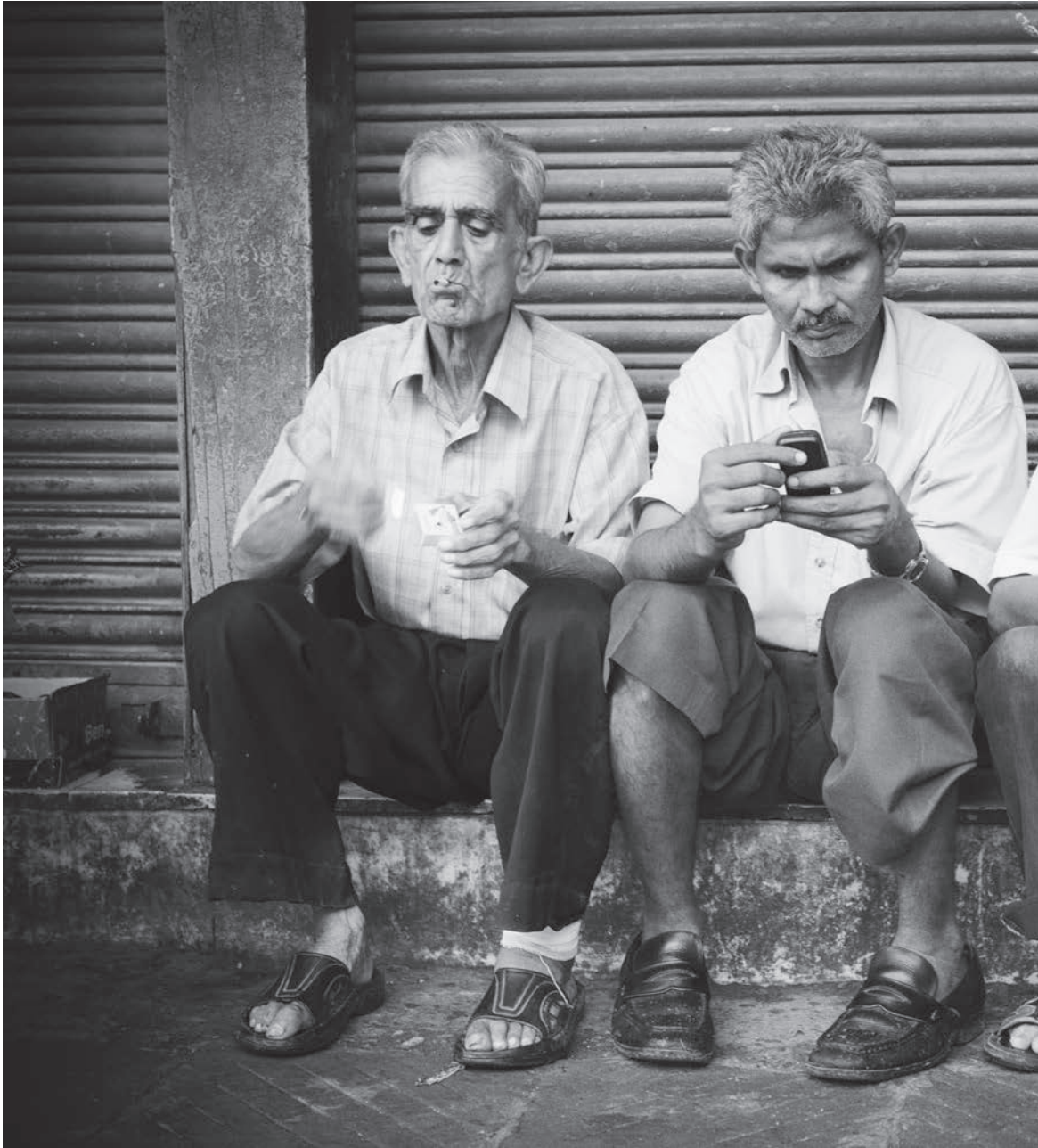
Old Delhi, Indie 2009