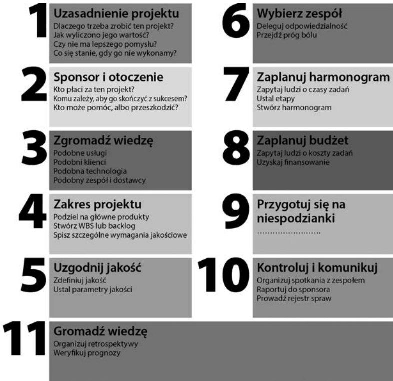
Rysunek W.1. Mapa kroków w projekcie

po czaszkach wrogów wspina się ku chwale na Olimp, gdzie może spotkać innych bohaterów i razem z nimi przy ambrozji snuć opowieści o walecznych czynach.