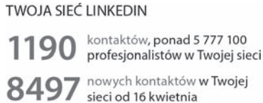
Rysunek 2.1. LinkedIn pomaga śledzić rozwój sieci kontaktów

stronie swojego profilu znajdziesz informacje na temat Twojej sieci LinkedIn (por. rysunek 2.1). Przedstawione tu informacje umożliwiają monitorowanie ogólnych rozmiarów rozwijającej się sieci kontaktów. Aby dokładnie zrozumieć potencjał serwisu LinkedIn, powinieneś zapoznać się z faktycznym znaczeniem tych trzech informacji.