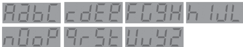
Rysunek 3.2. Sposób wyświetlania liter alfabetu łacińskiego na wyświetlaczu 4-znakowym

Wyświetlacz 4-znakowy może prezentować wszystkie cyfry arabskie (od 0 do 9), a także 20 spośród 26 liter alfabetu łacińskiego (niektóre zarówno w formie wielkiej, jak i małej litery). Przykłady liter na wyświetlaczu tego typu pokazano na rysunku 3.2. (Istnieją pewne konwencje dotyczące wyświetlania takich liter jak k , m , v , w czy x , jednak nawet stosowanie tych standardów nie rozwiązuje problemu błędnego rozpoznawania wymienionych liter przez większość ludzi — niektóre z nich sprawiają wrażenie losowo podświetlanych segmentów i są interpretowane raczej jako efekt błędów).