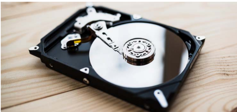
Rysunek 2.4 Na zdjęciu dysk HDD.

W przypadku dysków warto zwrócić uwagę na: