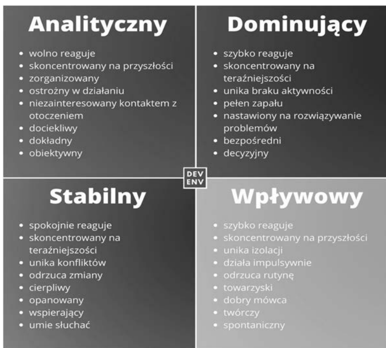
RYSUNEK 5.2. Infografika przedstawiająca kolory charakterów i główne cechy