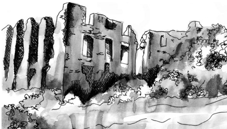
Ruiny zamku w Rabsztynie, rys. A. Fidzińska

czasów rezydencji. Kolejni właściciele wybudowali u stóp Kruczej Skały dwór starościński i folwark, w którym zamieszkali. Na początku XIX w. zamek został zupełnie opuszczony.