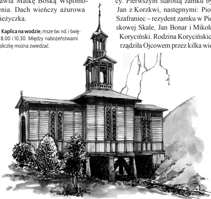
Kaplica na wodzie