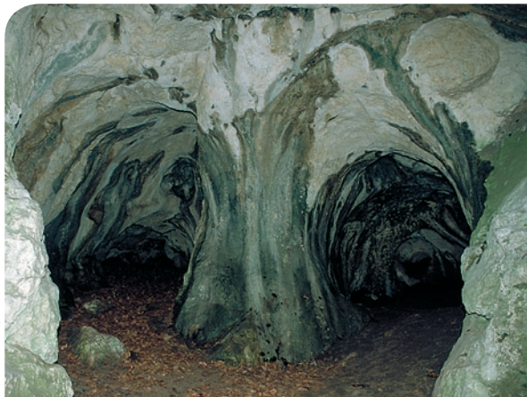
fol. Bogusław Czerwiński