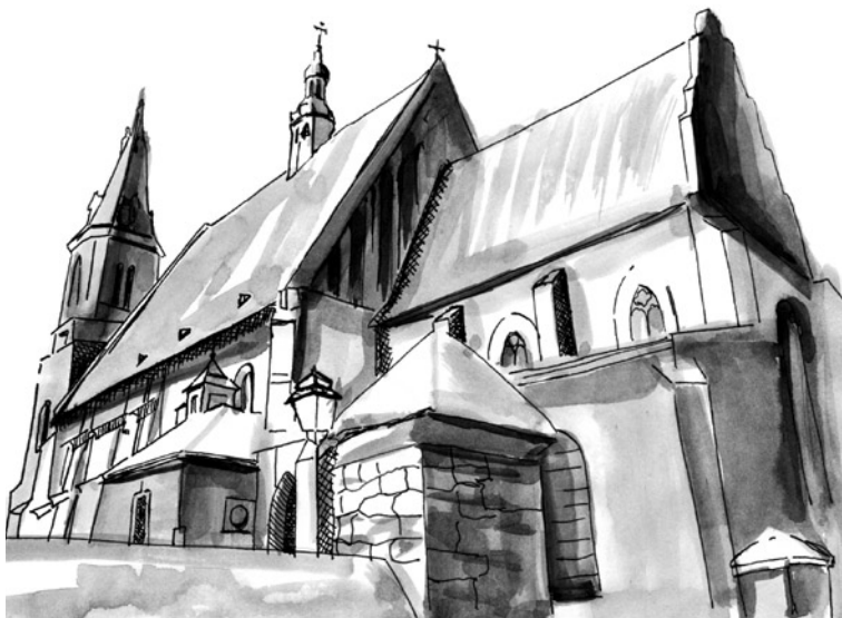
Bazylika Mniejsza św. Andrzeja Apostoła, rys. A. Fidzińska

Jerzy Nitrowski. Na organach, dzięki oryginalnym XVII-wiecznym mechanizmom, można wykonywać brzmiającą jak przed wiekami muzykę renesansową i wczesnobarokową. Od kilku lat w kościele organizowane są Dni Muzyki Organowej.