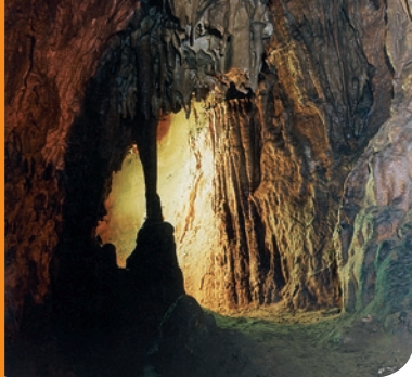
fol. Tomasz Gębuś