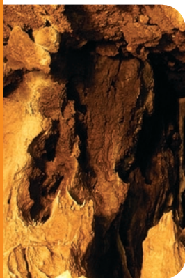
fol. Tomasz Gębuś