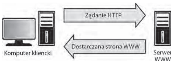
RYSUNEK 1.3. Komunikacja między klientem a serwerem WWW

Na rysunku 1.3 komputer kliencki to maszyna żądająca zasobu z serwera. Głównym zada- niem serwera WWW jest udostępnianie dokumentów HTML i powiązanych zasobów (na przykład zdjęć) w odpowiedzi na żądania klienta. Najłatwiejszy sposób na zapamiętanie ról komputera klienckiego i serwera to wyobrażenie sobie komputera jako klienta, a serwera jako dostawcy usług. Większość profesjonalnych narzędzi informatyki śledczej potrafi skutecznie zarejestrować zawartość pamięci RAM, gdy komputer jest włączony. Dostępnych jest też wiele bezpłatnych narzędzi do analizy pamięci RAM.