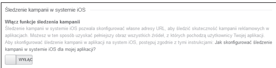
Rysunek 4.3. Kontrolka do włączania śledzenia kampanii iOS

Pierwszym krokiem, niezbędnym do umieszczenia danych iTunes w narzędziu Google Analytics, jest włączenie w usłudze Google Analytics, w sekcji Administracja funkcji śledzenia kampanii. W tym celu zaloguj się do swojego konta i kliknij powyższy odnośnik w górnej części ekranu. Następnie wybierz usługę, z którą chcesz połączyć aplikację (ponieważ łączenie odbywa się na poziomie usługi, wszystkie widoki w danej usłudze będą zawierały dane), i kliknij odnośnik Ustawienia usługi . Pojawi się kontrolka podobna do pokazanej na rysunku 4.3.