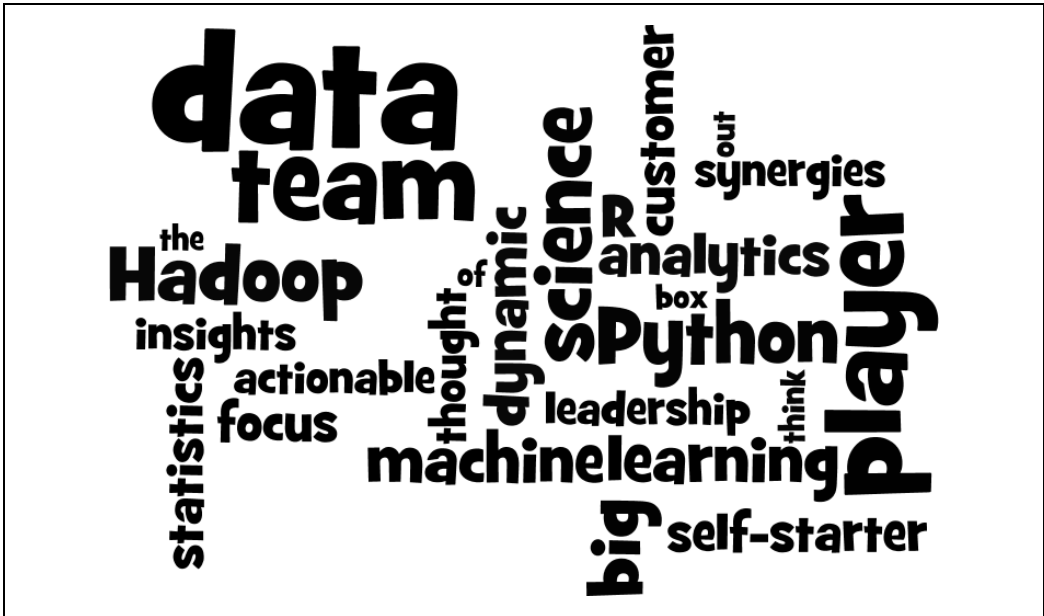
Rysunek 21.1. Chmura wyrazowa

Chmura wyrazowa wygląda ładnie, ale tak naprawdę przekazuje mało informacji. Ciekawszym rozwiązaniem byłoby umieszczenie wyrazów tak, aby położenie wyrazów w płaszczyźnie poziomej było zależne od częstotliwości ich występowania w ofertach pracy, a położenie w płaszczyźnie pionowej było zależne od częstotliwości ich występowania w życiorysach zawodowych. Z takiej wizualizacji można wyciągnąć więcej wniosków (zobacz rysunek 21.2):