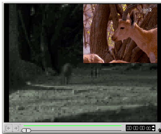
Rysunek 8.1. Dwie sceny nałożone na siebie

Nakładanie na siebie dwóch scen jest dość prostym zadaniem — wymaga wybrania opcji Overlay z górnego okna w głównym oknie programu. Na rysunku 8.2 umieściłem widok głównego okna programu po wybraniu opcji Overlay .