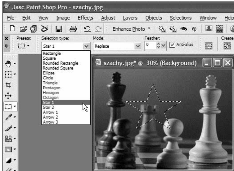
Rysunek 3.2. Wybór kształtu ramki wyboru