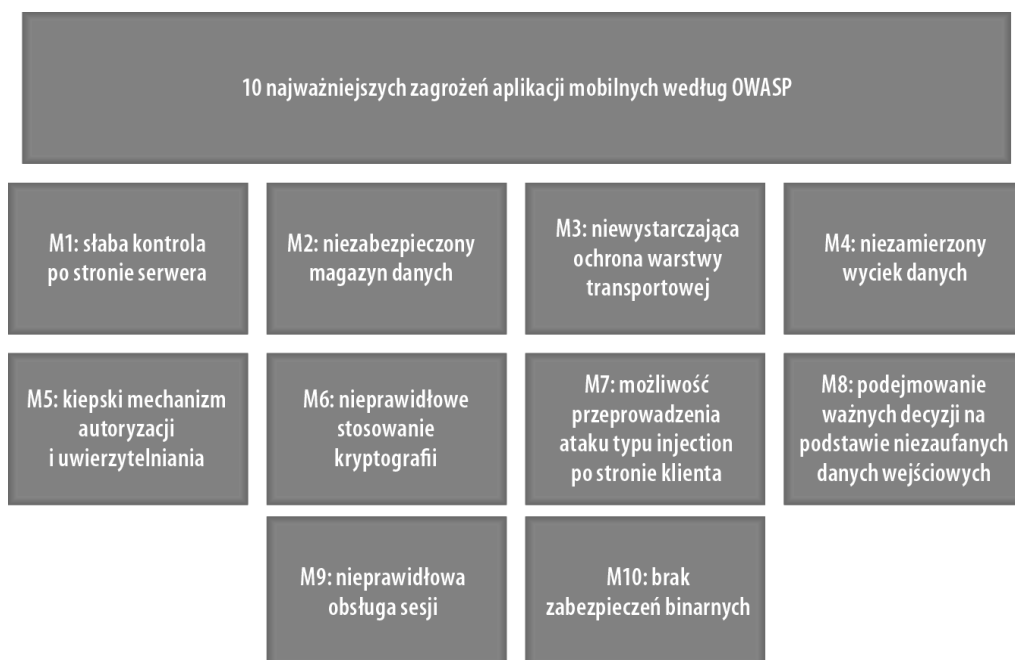
Rysunek 1.2. Wymienione przez grupę OWASP dziesięć najważniejszych problemów związanych z bezpieczeństwem na platformach mobilnych

Podobnie jak w przypadku dziesięciu największych zagrożeń OWASP, twórcy projektu Mobile Security zdefiniowali odpowiadających im dziesięć najważniejszych problemów związanych z bezpieczeństwem na platformach mobilnych. W tym zakresie projekt dość szeroko kategoryzuje pewne największe zagrożenia. Teraz pokrótce podsumuję pozycje wymienione na tej liście OWASP. Znacznie bardziej szczegółowe omówienie poszczególnych problemów i wskazówki dotyczące ich rozwiązań znajdziesz na stronie wiki projektu pod adresem https://www.owasp.org/index.php/OWASP_Mobile_Security_Project#tab=Top_10_Mobile_Risks . Graficznie dziesięć najważniejszych problemów według OWASP pokazałem na rysunku 1.2.