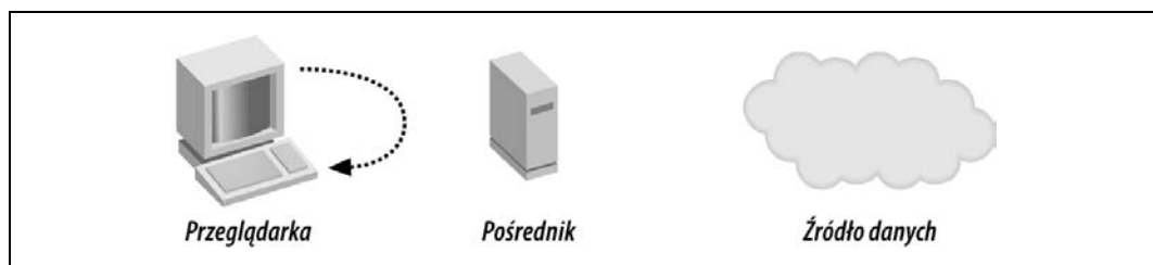
Rysunek 5.4. Jeśli odpowiedź jest zbuforowana w pamięci przeglądarki, żądanie nie zostaje dostarczone do pośrednika, przez co nie powoduje wygenerowania jakiegokolwiek ruchu sieciowego.

Buforowanie danych po stronie serwera znacznie zwiększa szybkość pobierania informacji, ponieważ ogranicza transmisję sieciową do pojedynczego odwołania. Serwer nie musi komunikować się z zewnętrznym źródłem danych. Pośrednik może dodatkowo wygenerować nagłówki, które poinformują przeglądarkę o obowiązku zbuforowania odpowiedzi na określony czas. Przed upływem tego czasu ewentualne odwołania do pośrednika będą zastępowane pobraniem danych z pamięci podręcznej, co jest wyjątkowo szybkie. Zatem kolejne odwołania do serwera proxy w celu pobrania tych samych danych nie będą wcale wymagały przesyłania żądań przez sieć, tak jak to zostało pokazane na rysunku 5.4.