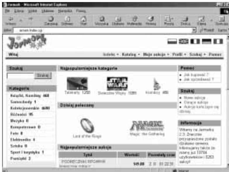
Rysunek 3.16. Dom aukcyjny Jarmark

Internetowy serwis aukcyjny (rysunek 3.16). Towary podzielone są na kategorie: Książki i komiksy, Samochody, Kolekcjonerskie, Różności, Muzyka, Komputerowe, Foto, Elektronika, Sztuka, Sport i turystyka, Pamiątki . Najwięcej znaleźć można ofert o charakterze kolekcjonerskim. Weryfikacja solidności użytkowników na podstawie systemu komentarzy. Oferty można przeglądać, korzystając z wyszukiwarki.