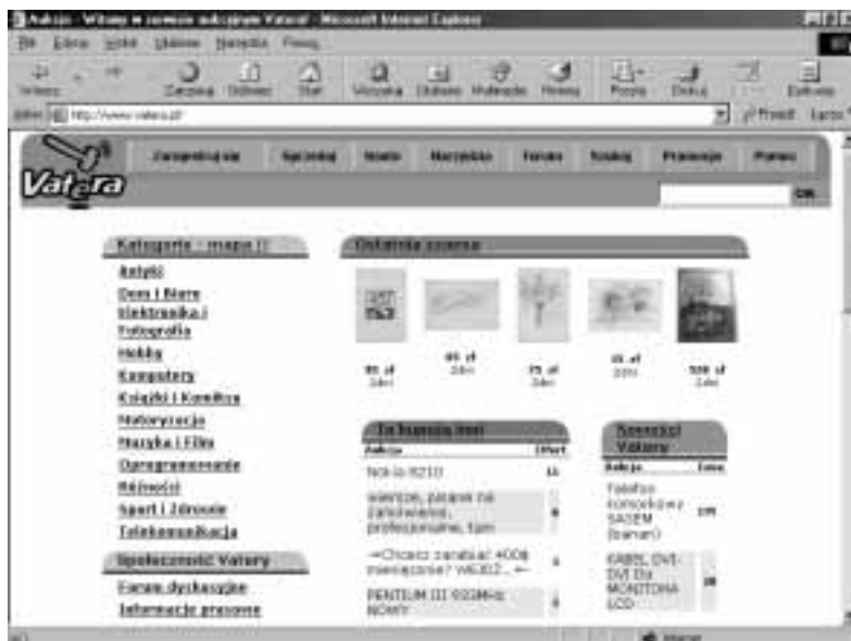
Rysunek 3.27. Dom aukcyjny Vatera

Serwis aukcyjny (rysunek 3.27). Ma ładną szatę graficzną. W dwunastu kategoriach tematycznych można znaleźć niemal siedem tysięcy ofert. Wiele wystawianych towarów nie znajduje nabywców.