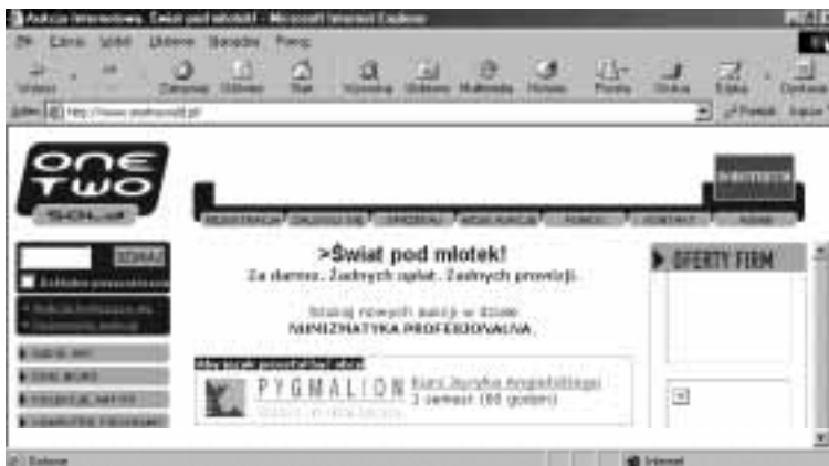
Rysunek 3.20. Dom aukcyjny Świat pod młotek

Serwis aukcyjny (rysunek 3.20). Za korzystanie z serwisu nie są pobierane opłaty. Dane każdego z użytkowników potwierdzane są telefonicznie. Konta użytkowników, których dane są niepełne, niepoprawne lub niemożliwe jest ich potwierdzenie telefonicznie, są blokowane. Do dyspozycji użytkowników oddano m.in. wyszukiwarkę ofert.