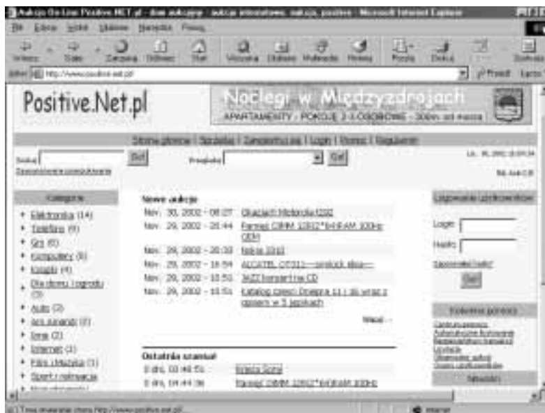
Rysunek 3.23. Dom aukcyjny Positive.Net.pl

Serwis aukcyjny (rysunek 3.23). Zawiera system ocen użytkowników. Mimo funkcjonowania serwisu pomoc na temat bezpieczeństwa transakcji jest dopiero w trakcie tworzenia. Towary podzielone są na następujące kategorie: Elektronika, Gry, Komputery, Telefony, Książki, Dla domu i ogrodu, Ars Amandi, Auto, Inne, Internet, Film i Muzyka, Sport i rekreacja, Nieruchomości .