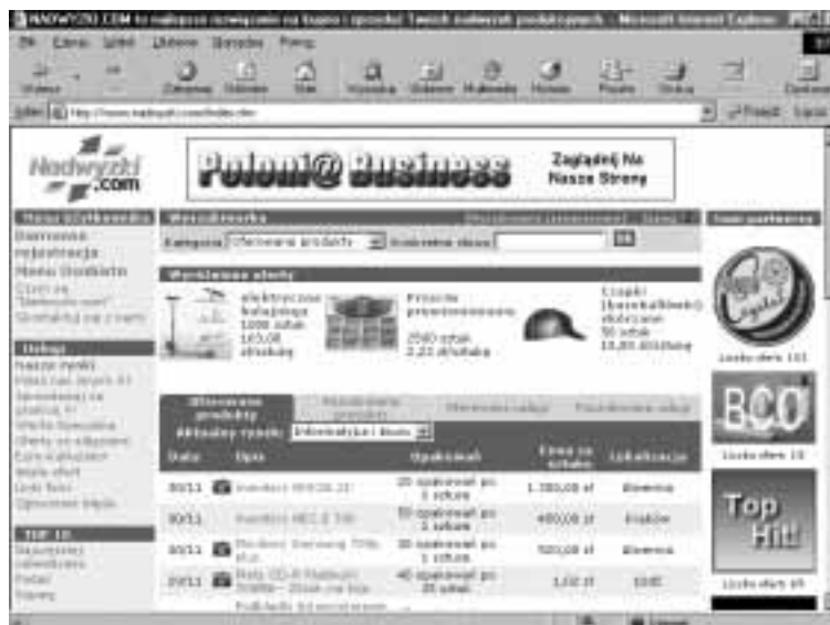
Rysunek 3.18. Dom aukcyjny Nadwyzki.com

Serwis Nadwyzki.com (rysunek 3.18) oferuje poprzez Internet szybkie i skuteczne rozwiązania problemów firmom, które oferują do sprzedaży swoje nadwyżki produkcyjne. Pomaga również tym firmom, które szukają produktów w atrakcyjnych cenach. Wszystkie usługi, jakie oferuje serwis, są darmowe.