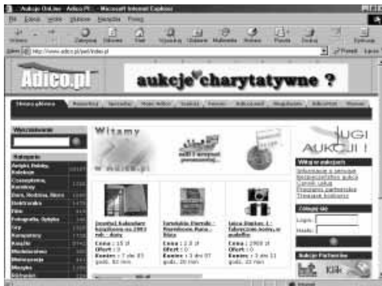
Rysunek 3.7. Dom aukcyjny Adico

Serwis aukcyjny (rysunek 3.7). Około 25 tysięcy ofert w następujących kategoriach: Antyki, Hobby, Kolekcje, Czasopisma, Komiksy, Dom, Rodzina, Biuro, Elektronika, Film, Fotografia, Optyka, Gry, Komputery, Książki, Modelarstwo, Motoryzacja, Muzyka, Różności, Sport i Zdrowie, Telekomunikacja . Użytkownicy mają do dyspozycji forum, wyszukiwarkę, system komentarzy oraz zabezpieczenie transakcji systemem Gwarant . Preferowane jest dysponowanie kontem w SKOK-u — Spółdzielczej Kasie Oszczędnościowo-Kredytowej . Aby stać się jej członkiem, należy okazać oryginalne dokumenty (a nie ich kserokopie!), jak np. dowód osobisty, zaświadczenie o zatrudnieniu itp.