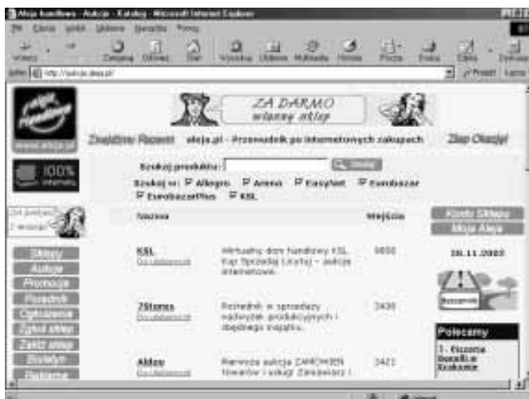
Rysunek 3.5. Wyszukiwarka produktów podpowiada, który dom aukcyjny wybrać

Na stronie głównej katalogu aukcji Aleja Handlowa znajduje się okienko wyszukiwarki. Po wpisaniu słowa kluczowego przeszukiwanych jest sześć serwisów aukcyjnych: Allegro , Arena , EasyNet , Eurobazar , EurobazarPlus oraz KSL . Wyniki wyszukiwania zawsze pokazują aktualną zawartość serwisów aukcyjnych. Daje to możliwość znacznej oszczędności czasu (rysunek 3.5).