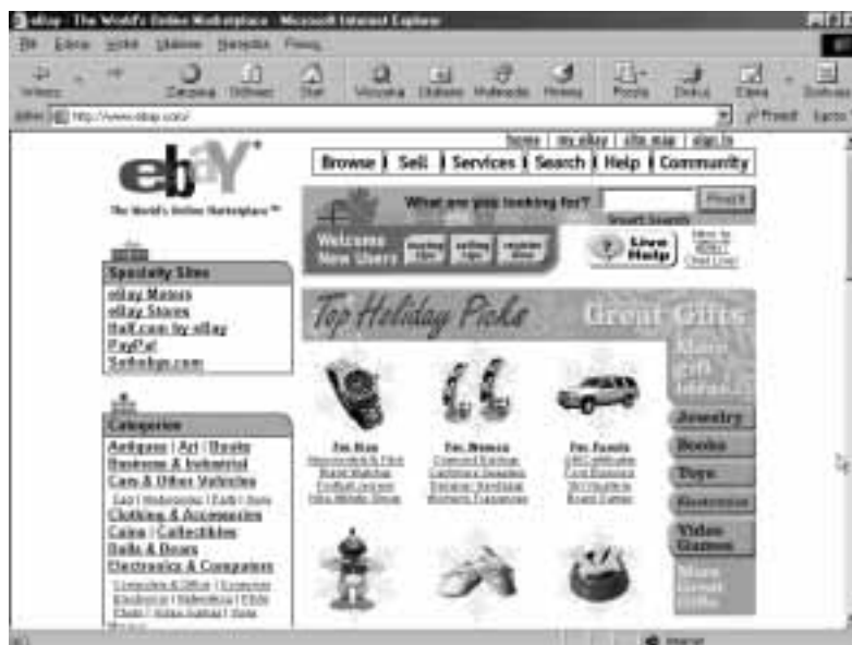
Rysunek 3.2. Pionier i lider aukcji internetowych

W eBay handluje się nie tylko drobiazgami. W serwisie można znaleźć informację ( http://cgi.ebay.com/ws/eBayISAPI.dll?ViewItem&item=1788349972 ), że za sumę dwunastu milionów dolarów został sprzedany 60-letni dom, w którym spędził dzieciństwo znany amerykański raper Eminem. Fani Eminema złożyli 253 oferty kupna.