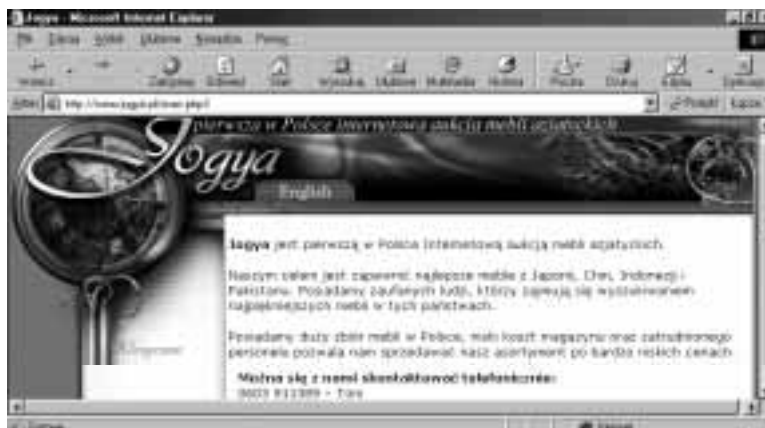
Rysunek 3.17. Dom aukcyjny Jogya

Internetowa aukcja mebli azjatyckich (rysunek 3.17). Klient może wybrać artykuł i zaproponować cenę. Jeśli w ciągu 14 dni nikt nie podbije oferty, uczestnik nabywa mebel. Towar jest dostarczany pod wskazany adres. Klient płaci tylko wtedy, gdy jest zadowolony z wybranego towaru.