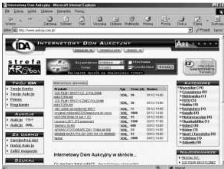
Rysunek 3.10. Internetowy Dom Aukcyjny

Bezpłatne aukcje online (rysunek 3.10). Aukcje przedmiotów nowych i używanych. Rozbudowany system pomocy. Użytkownik ma do dyspozycji: mechanizm ułatwiający korzystanie z aukcji osobom, które regularnie sprzedają dużo przedmiotów z pewnej ustalonej, stałej puli; program do importu aukcji z plików tekstowych, system oceny użytkowników, automatycznego licytatora, system przypomnienia o zakończeniu aukcji, system pytań zadawanych sprzedającym i ich odpowiedzi, ekscytujące aukcje 15-minutowe oraz powiadamianie o przebiegu oferty.