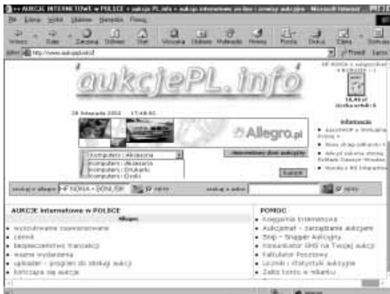
Rysunek 3.6. Niezbędny uczestnik aukcji